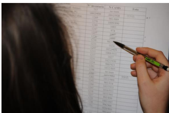
Fig. 2 - Le ragazze dell'ASL alle prese con la catalogazione dei campioni delle collezioni dei musei del Polo museale universitario di Casalina.