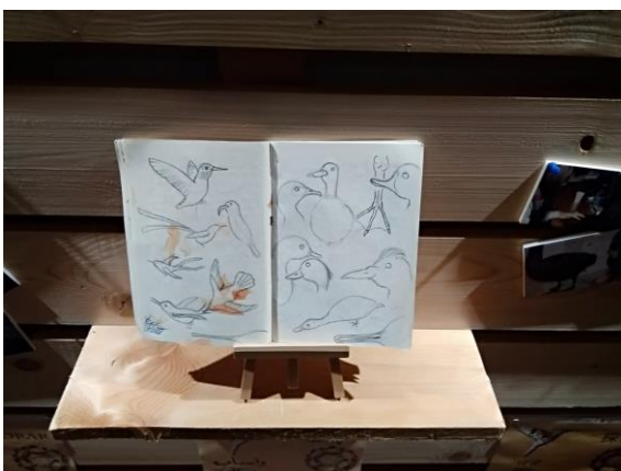
Fig. 8 - Ogni studente, all'inizio dell'esperienza di ASL, è stato "dotato" di un diario museale dove disegnare quello che più richiamava la sua attenzione, all'interno degli spazi del museo (aree espositive, magazzini, depositi ed aree verdi). Il diario si è anche rivelato uno "strumento" dove appuntare le osservazioni e le "sensazioni" dello studente nello svilupparsi del percorso storico, tassonomico e culturale tra le collezioni dei musei del Polo museale universitario, attraverso il metodo scientifico.