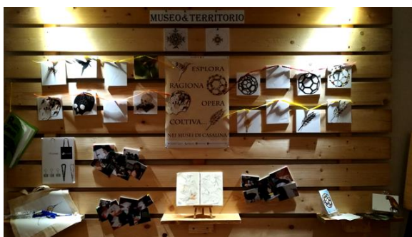
Fig. 11 - Uno spazio museale, individuato nell'ambito dell'itinerario di visita della Galleria di Storia Naturale, allestito dai ragazzi e dedicato alle attività di progettazione realizzate nell'arco di tempo dell'esperienza di ASL, condotta presso il Polo museale universitario di Casalina (Deruta-PG).