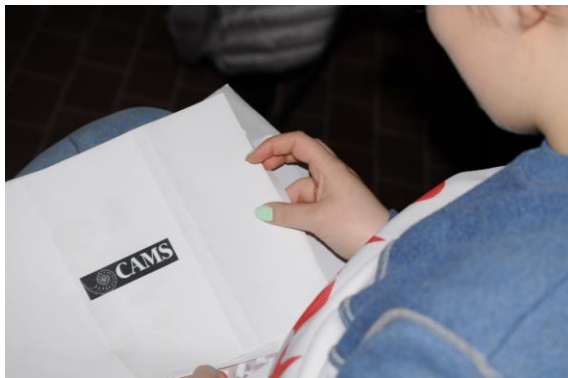
Fig. 1 - Le ragazze dell'ASL mentre acquisiscono il materiale iconografico utile per la progettazione del materiale grafico, da utilizzare per la "comunicazione" del Polo museale verso i possibili utenti.

-UNIPG_ Musei & Territorio. Comunicare per immaginare, esplorare e sperimentare