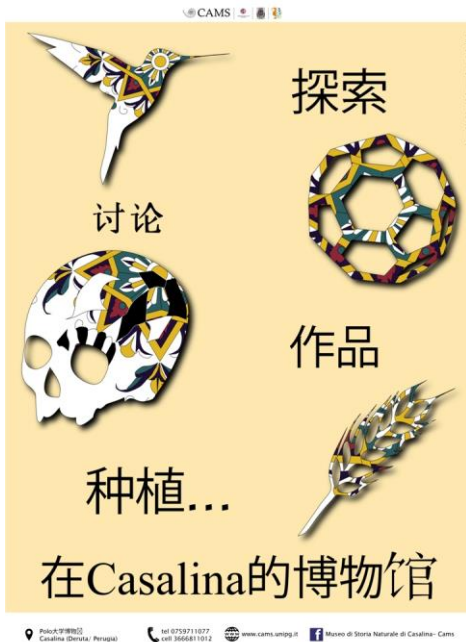
Fig. 5 - Il manifesto realizzato è stato tradotto in diverse lingue (es. in cinese), in modo da "comunicare" missione e valori dei musei, alle diverse culture presenti nel territorio del Comune di Deruta (PG).