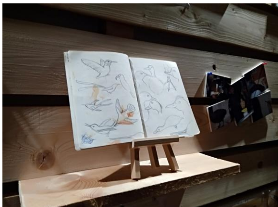
Fig. 9 - Ogni studente, all'inizio dell'esperienza di ASL, è stato dotato di un "diario museale" personale dove disegnare quello che più richiamava la sua attenzione all'interno degli spazi del museo (aree espositive, magazzini, depositi ed aree verdi). Il diario si è anche rivelato uno "strumento" dove appuntare le osservazioni e le "sensazioni" dello studente nello svilupparsi del percorso storico, tassonomico e culturale tra le collezioni dei musei del Polo museale universitario, attraverso il metodo scientifico.