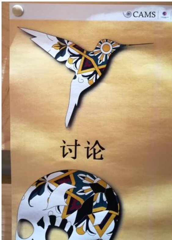
Fig. 6 - Particole del manifesto realizzato in lingua cinese dove è evidente l'uso di temi legati alla produzione della ceramica, uno degli elementi culturali e artigianali cardine del tessuto sociale e produttivo locale, per "legare" il progetto di comunicazione dei musei della scienza al territorio locale.