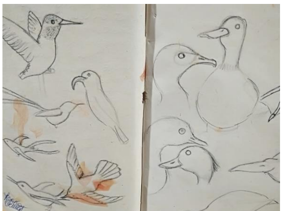
Fig. 10 - Particolare del "diario museale" personale, fornito ad ogni studente all'inizio dell'esperienza di ASL.